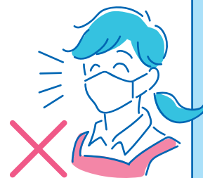
できる限り 会話の抑制